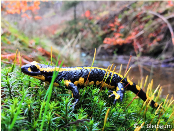
Abb. 2 - In typischer lebensraumbegleitender Quellvegetation