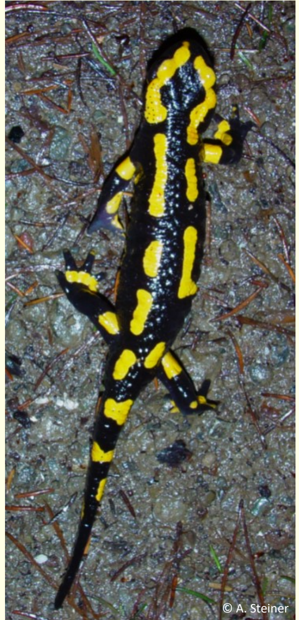
Abb. 1 - Typischer Passgang des Feuersalamanders

Die Gliedmaßen sind im Vergleich zum Körper klein und mit Zehen ausgestattet. Der Kopf ist rund und verfügt über ein breites Maul. Da ihre Haut an Land vor Austrocknung nicht ausreichend geschützt ist, sind sie an Land immer auf feuchte Umgebung angewiesen.